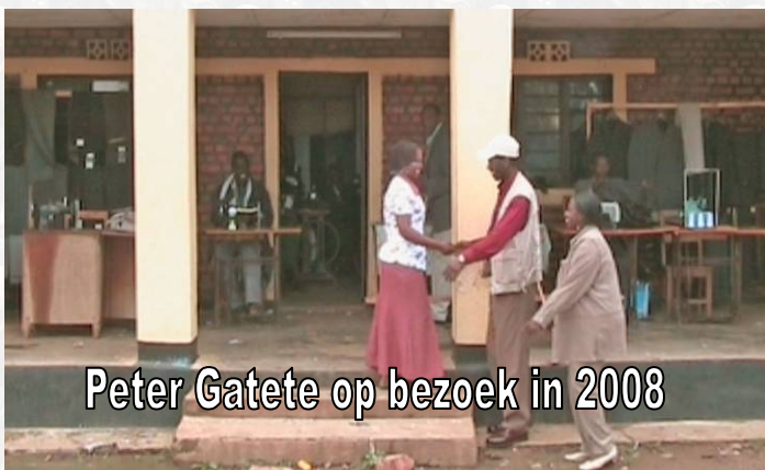
Peter Gatete op bezoek in 2008