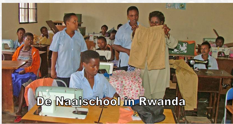
De Naaischool in Rwanda