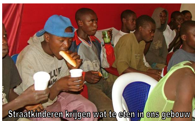
Straatkinderen krijgen wat te eten in ons gebouw

Wij wensen u een gezegend Kerstfeest en een voorspoedig 2010 !