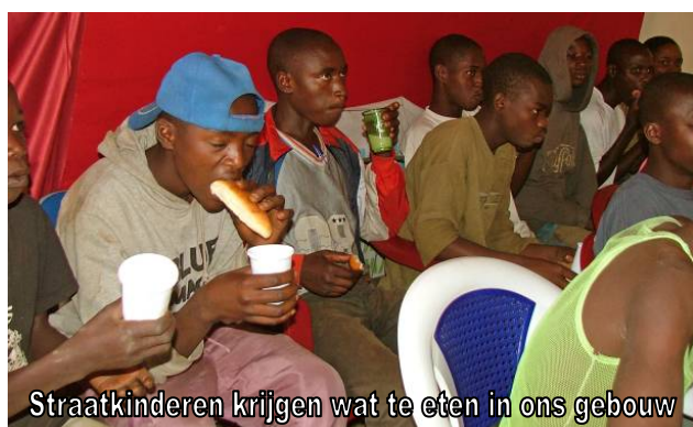
Straatkinderen krijgen wat te eten in ons gebouw

Wij wensen u een gezegend Kerstfeest en een voorspoedig 2010 !