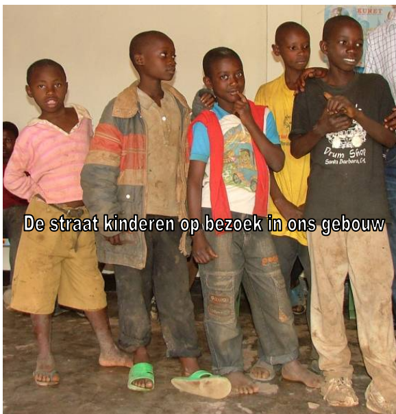
De straat kinderen op bezoek in ons gebouw

Om met dit project het gewenste doel te bereiken willen wij de samenleving bij de huidige toestand van de straatkinderen betrekken. Wij willen hen bewust maken van hun rol in de verbetering van de situatie. Dit houdt in dat wij een beroep doen op kerken, de overheid, en indien mogelijk op de familie van het desbetreffende kind.